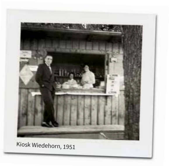
Kiosk Wiedehorn, 1951