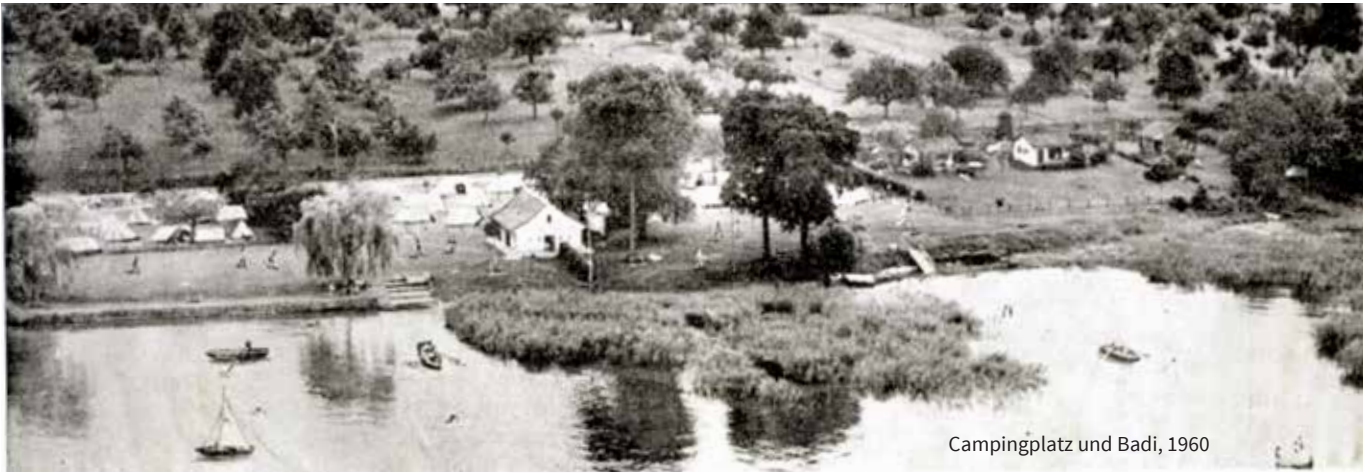
Campingplatz und Badi, 1960