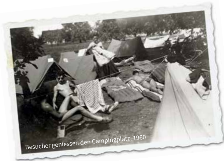
Besucher geniessen den Campingplatz, 1960